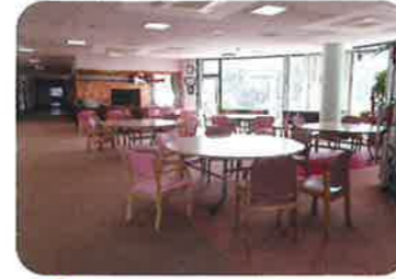
① ホール (ホーム・デイ)

南鷗荘は、 だれでも是非入りたいと願う施設、 自分自身が入りたいと願う施設を 目指しています。