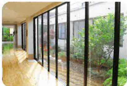
⑪ 廊下から中庭を望む